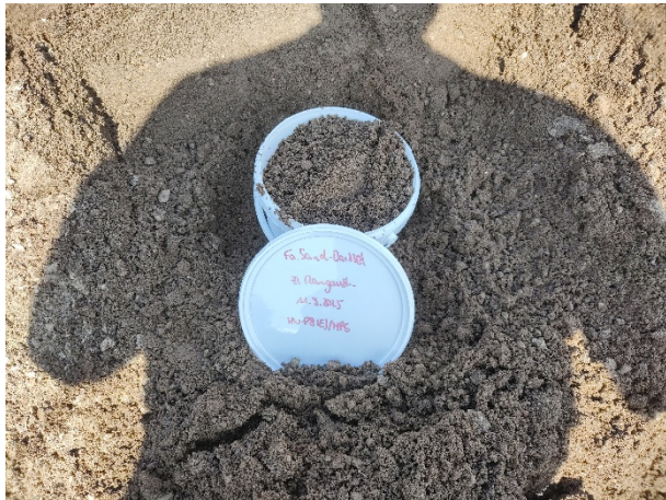
Abb. 9: Fa. Sand-Barthel, HW-P8 (E)/MP6, 11.09.2025