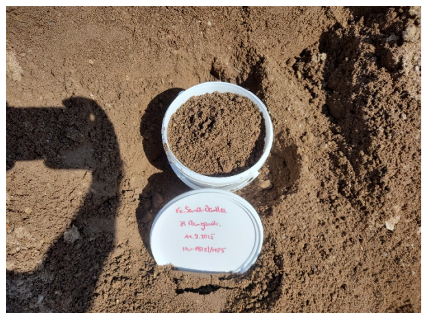
Abb. 8: Fa. Sand-Barthel, HW-P8 (E)/MP5, 11.09.2025