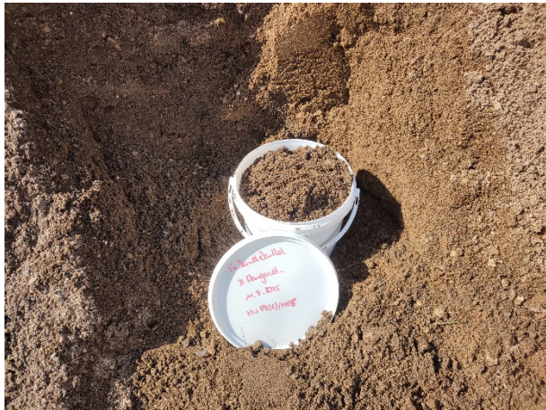
Abb. 11: Fa. Sand-Barthel, HW-P8 (E)/MP8, 11.09.2025