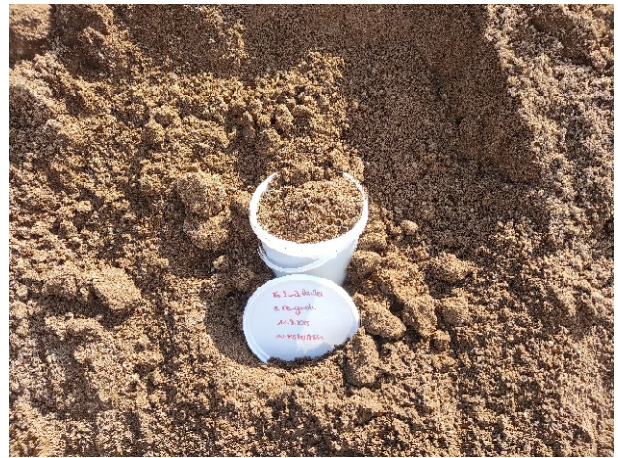
Abb. 4: Fa. Sand-Barthel, HW-P8 (E)/MP1, 11.09.2025