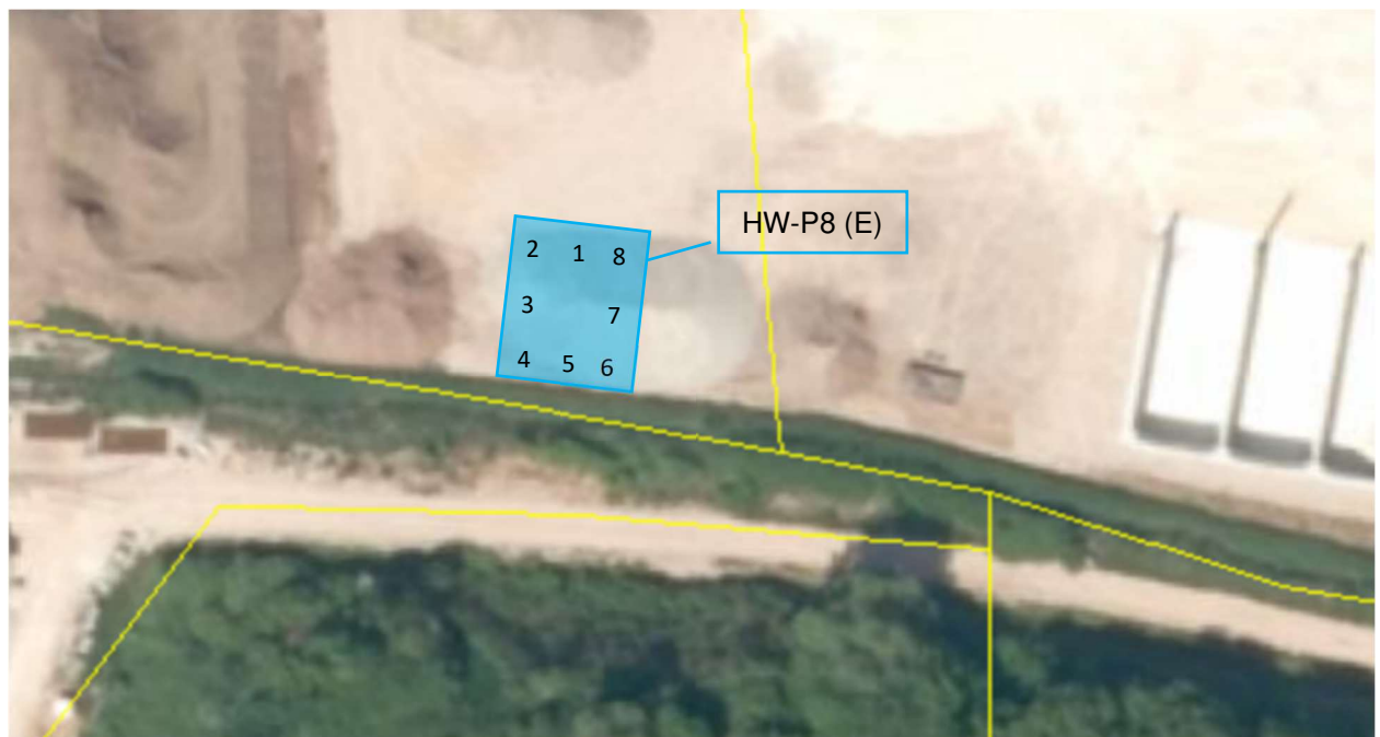
Abb. 2: Fa. Sand-Barthel, ZL Rangastraße, ca. Lage des Hauswerks HW-P8 (E), 11.09.2025