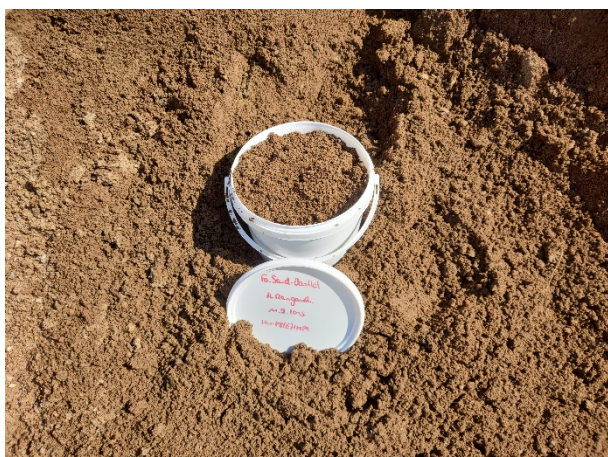
Abb. 7: Fa. Sand-Barthel, HW-P8 (E)/MP4, 11.09.2025