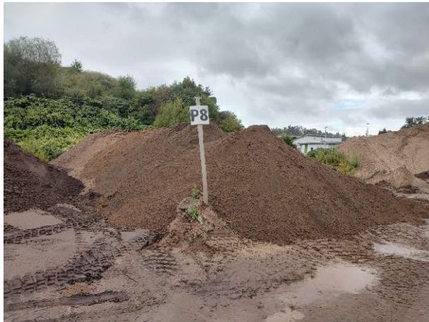
Abb. 3: Fa. Sand-Barthel, HW-P8 (E), 11.09.2025