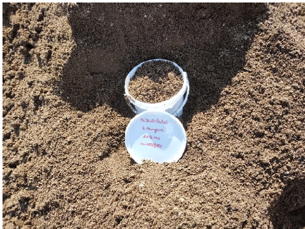
Abb. 5: Fa. Sand-Barthel, HW-P8 (E)/MP2, 11.09.2025