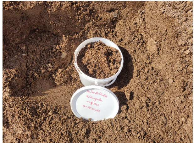
Abb. 10: Fa. Sand-Barthel, HW-P8 (E)/MP7, 11.09.2025