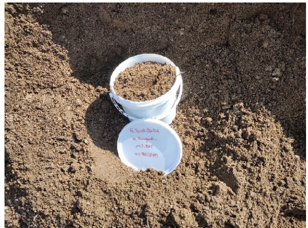
Abb. 6: Fa. Sand-Barthel, HW-P8 (E)/MP3, 11.09.2025